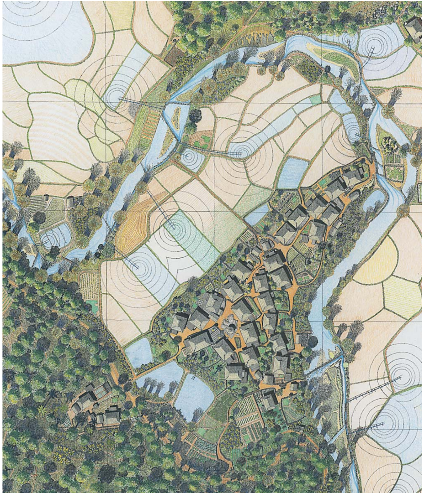
Häuser wie Treibgut am Fluss: Brandt maß traditionelle Siedlungen in Asien auf und zeichnete sie dann minutiös.

Man kann dieses Buch als minutiöse Dokumentation eines uralten Bauwissens lesen, das zusammen mit den ruralen Strukturen Asiens zu verschwinden droht. Das wäre die melancholische Lesart. Man könnte in dem Atlas aber auch einen Wegweiser sehen, die Anleitung für ein anderes Bauen. NIKLAS MAAK